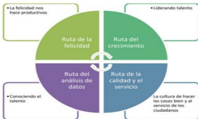
Ilustración 4 Rutas de creación de valor para los resultados eficaces de la GETH

Este plan de acción se debe diseñar de conformidad con los resultados de las “Rutas de creación de valor”, estas son agrupaciones temáticas que, trabajadas en conjunto, permiten impactar en aspectos puntuales y producir resultados eficaces para la GETH y que se encuentran expuestas en el siguiente gráfico: